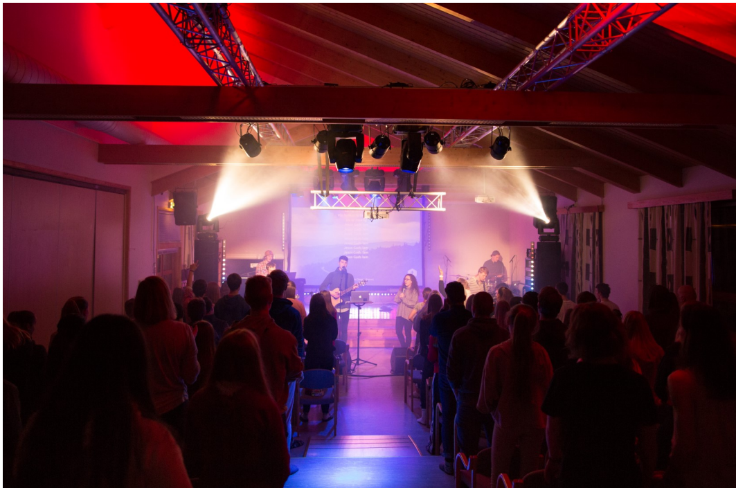
Mykje lyd og lys er viktige effektar på Crossroad. Ungdommane trivest med det!