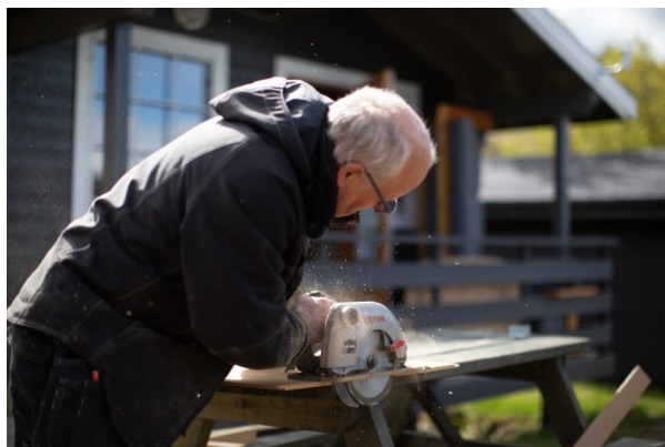
Presisjonsarbeid med saga!