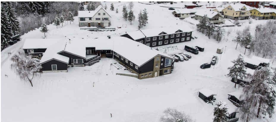
Lyngmo i vinterdrakt. Dronebilete frå i vinter.

Som dagleg leiar er det utruleg viktig å ha ein god stab med tilsette. Nyleg hadde me vår faste vår- og sommarsamling med dei tilsette. Det er ein flott gjeng å vera saman med! Fartstida blant dei tilsette varierer frå 3 til 15 år. Ein stabil gjeng som bidreg saman og som hjelper kvarandre når det er behov for det. Drifta er mykje enklare når me får jobbe saman over tid. Me er heldige som får vera ein del av «Team